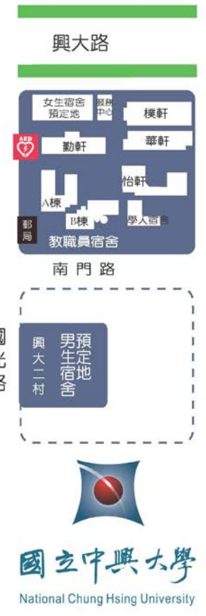
校區位置總配置圖