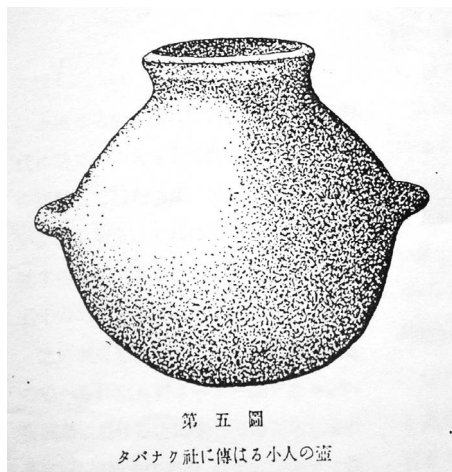
排灣族大板鹿社所保存的矮黑人陶甕。 鹿野忠雄繪，1932 年

大板鹿社的排灣族說：他們的祖先和矮黑人一直維持著友好關係。頭目出示一個矮黑人的陶甕，高 1 尺 3 吋，據說是遠古的時候，矮黑人為了示好，贈給頭目的祖先保存的。鹿野認為這一個陶甕，與一般的排灣族頭目家保存的古甕不同。矮黑人的陶甕容積小，但是口緣寬大，沒有施加百步蛇雕飾。