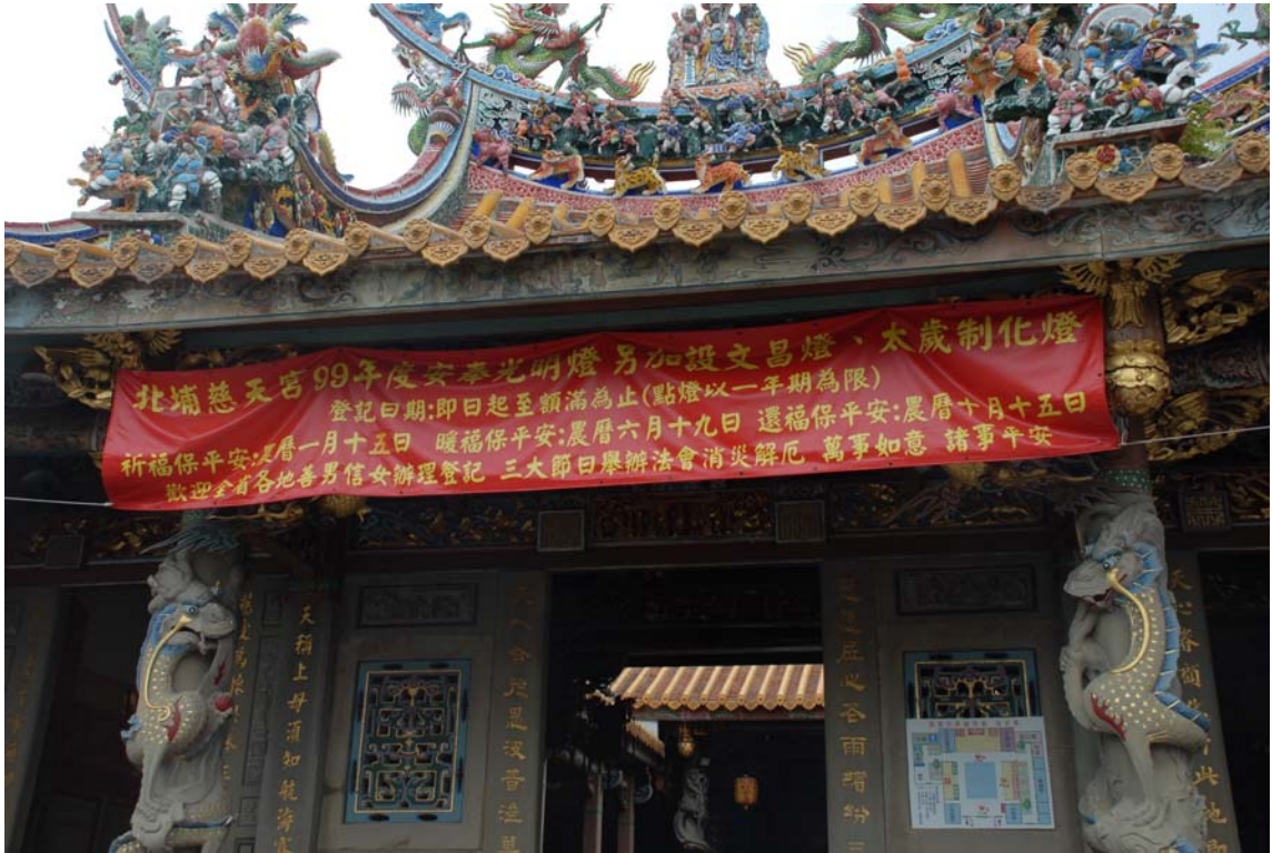
圖一：北埔慈天宮暖福告示