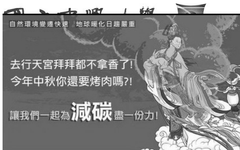
圖三：2014年經濟部宣導海報(2014年8月27日經濟部臉書)