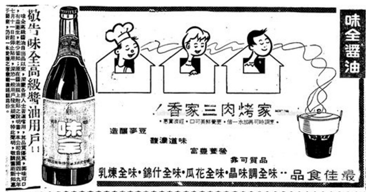
圖一：味全醬油「一家烤肉三家香」廣告(1960年7月11日《聯合報》頭版)

「中秋烤肉」無論其與社會經濟的交互影響過程、集體記憶的建構過程，乃至於群眾接受與反對的過程、政府的腳色問題等，著實是一個很好觀察風俗產生的案例。